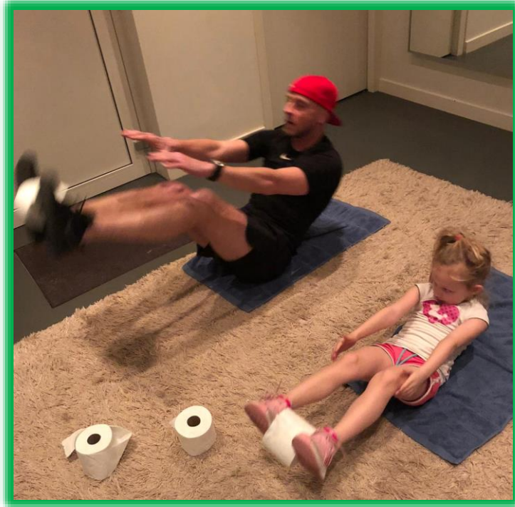
Fee en haar vader bezig met een echte work-out. Goed bezig allebei!